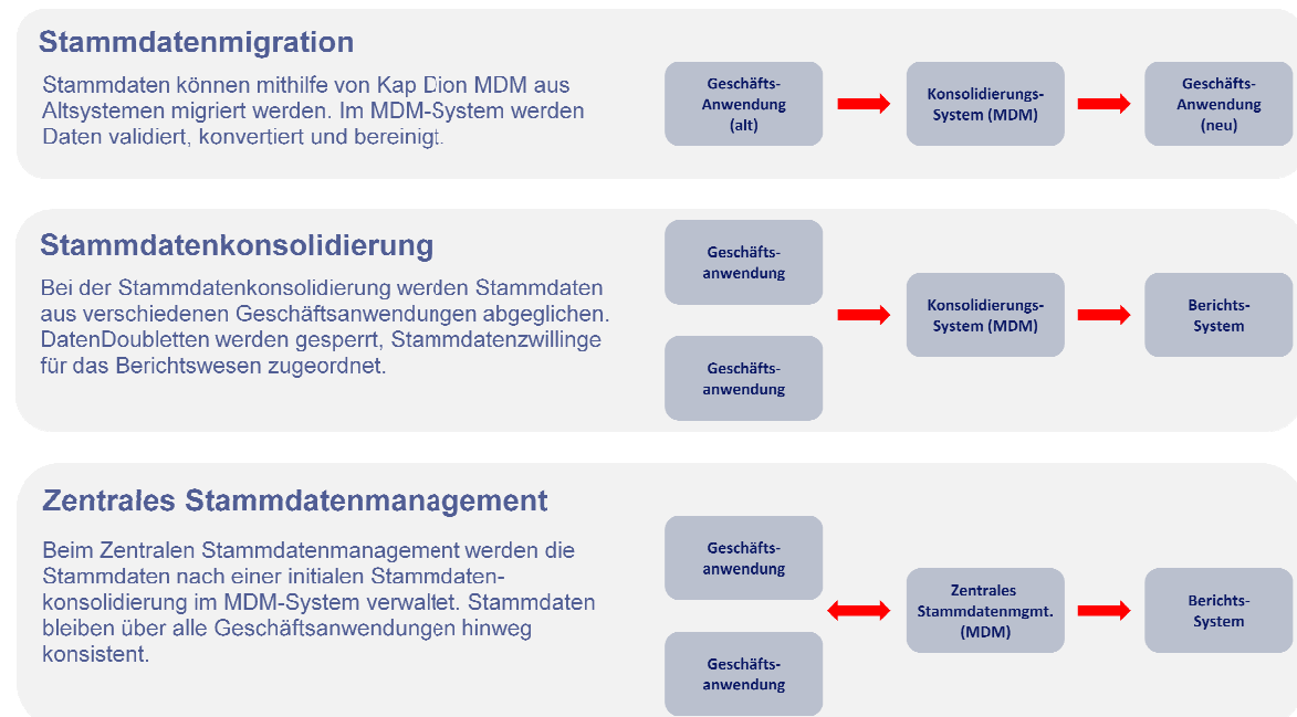
Abbildung 1: MDM-Szenarien

Aufgrund seiner Eigenschaft, Daten aus verschiedenen Quellen importieren, überprüfen und in ein frei definierbares Zielformat umwandeln zu können, eignet sich Kap Dion MDM auch für die Verwendung als komfortables Migrationstool. Da mehrere Import-Jobs parallel verarbeitet werden können, ist mit Kap Dion MDM auch die Bearbeitung großer Datenmengen möglich. Bei Bedarf kann auch bei der Migration eine Doublettenprüfung durchgeführt werden.